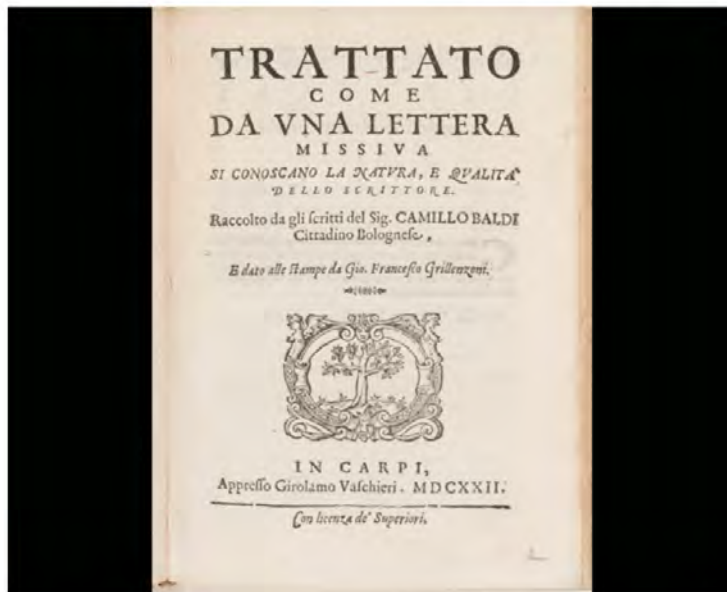
מה מאות שנים אנשים מאמינים שכתב ידו של אדם מלמד על אישיותו ועל כישוריו. הטקסט המוכר הקרום ביותר בנושא "מדע הגרפולוגיה", שחיבר קאמיילו באלדי בשנת 1622

תוצאות דומות חזרו והופיעו במחקרים שבדקו את יכולת הניבוי של גרפולוגים בעוד ועוד נושאים. ניתוח כתבי יד לא הצליח לחזות הצלחה בעבודה , להבחין בין סטודנטים מוחצנים או מופנמים , לנבא מאפיינים שונים , לאבחן תכונות אישיות , לחזות את מידת ההצלחה של סוכני מכירות , ושלל תחזיות ואבחונים אחרים שגרפולוגים טענו שבאפשרותם לבצע. מרגע שנוטרלו גורמים כמו ידע מוקדם על הכותבים או הבדלי תוכן בין החומרים הכתובים שהוצגו לגרפולוגים, אבחון על פי כתב יד לא היה מהימן יותר מניחוש אקראי לצורך ניבוי תכונות אישיות, באבחון נטיות או איתור כישורים ויכולות.