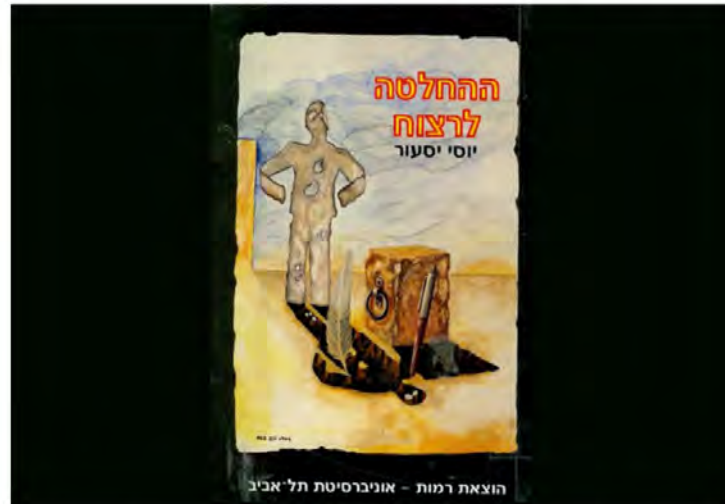
"ההחלטה לרצוח", מכתבים מאנשים לא חוקפניים עם יחסי אנוש טובים. לפחות מבחינה גרפולוגית | בריכת הספר

הראיונות ממחישים היטב כמה מועט המשקל הסגולי של הראיות, שכן הם משקפים שני כשלי חשיבה: האחד הוא הטיית אישור של המנהלים המרואיינים שמלכתחילה פנו לשרותיהם של גרפולוגים, ובאופן אנושי ייטו לחפש רק מידע שמאשר את דעתם ולהתעלם ממה שסותר אותה; והשני הוא כשל השורדים , הבא לידי ביטוי בכך שהמרואיינים הם רק אלה שיצאו מרוצים מהאבחון, ולא כל אלה שהתאכזבו ולא חזרו להיעזר בשירותיו של בעל האתר.