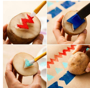
חותמות מתפוחי אדמה וחיתוכי עוגיות

לאחר הכנת חותמות ניתן להדפיס על מצעים שונים כגון: בריסטול, כריכה למחברת / יומן, תיק בד, חולצת טי וכו'. מומלץ להשמש בגואש או אקריליק.