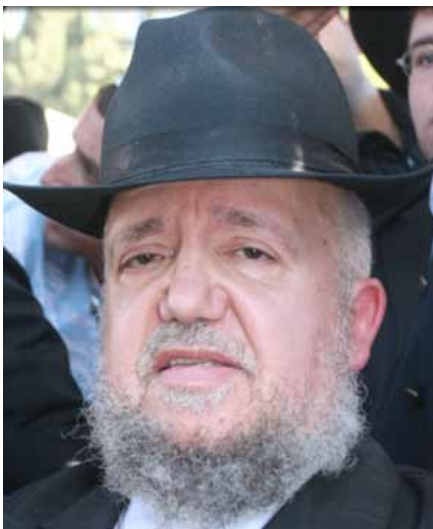
הגאון רבי מאיר מאזוז

במוסדות 'כסא רחמים' בבני ברק נתלתה מודעה המבקשת מתלמידי הישיבה להתפלל וללמוד לרפואתו של ראש הישיבה