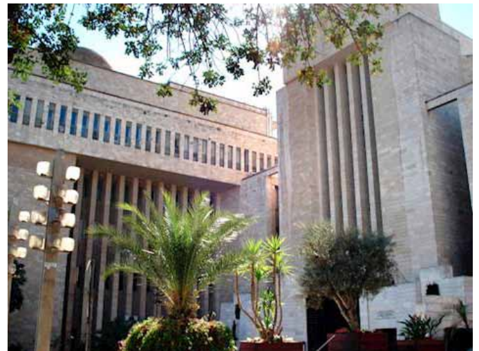
בית הכנסת הגדול בירושלים

הנהלת בית הכנסת הגדול בירושלים במכתב מיוחד למתפללי בית הכנסת הקבועים. בו הם סוקרים את האפשרויות שעמדו בפניהם, ומה היו הסיבות להחלטה ההיסטורית לסגור את בית הכנסת: השיקול המכריע הינו ביטחונם האישי של כל אחד ואחד מכם". אומרים בהנהלת בית הכנסת, ומוסיפים "מרכיב מכריע בשיקול זה הינו חוסר הידע, הבלבול, הוויכוח בין המומחים והשינויים בהנחיות. בית הכנסת הגדול אינו כבית תפילה אחר. הוא רחב, הוא מחייב בדיקות בריאות בכניסה, הוא מחייב מגבלה במספר המתפללים. וגם אם באלה נעמוד, עדיין הסיכון קיים. אחד ששגה, אחד שנמצא חיובי ולא ידע, אחד שיכול להדביק את האחר. את הסיכון הזה מבקש בית הכנסת הגדול למנוע מכל אחד ואחת מכם".