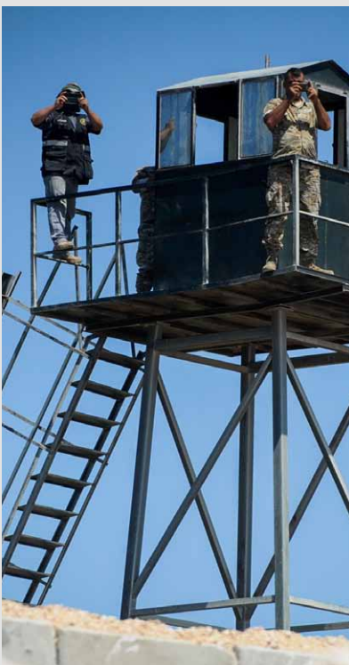
חייל לבנוני ומחבל חיזבאללה מתצפתים על ישראל

הסרטון. בסרטון נוסף מנהיג חיזבאללה חסן נסראללה משחרר גם הוא מסר מאיים לעבר ישראל ואומר: "אני אומר לאויב שישים לב היטב, אנחנו לא חוששים ממלחמה, אנחנו לא מהססים ולא נהסס להתמודד איתה. אנו נתמודד איתה אם היא תוטל עלינו וננצח בה בעזרת האל. האויב לא צריך לעשות חישובים מוטעים. אני לא מדבר על מלחמה פסיכולוגית או הפחדות, אני מדבר על העובדות שביטאנו בשטח."