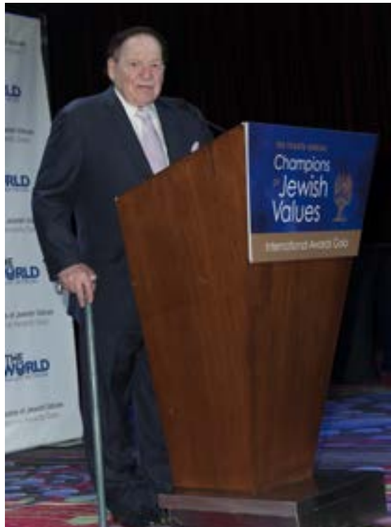
▲ מגדולי הפילנתרופים היהודיים. אדלסון

מבנה המוזיאון קיבל תרומה נכבדה ממשפחה בפורטוגל שמוצאה מדרום מזרח אסיה ושהיו קורבנות מחנות ריכוז ביפן בתקופת המלחמה. בשנת 2013 הקהילה היהודית בפורטו העבירה למוזיאון השואה בושינגטון את כל המוצגים מהארכיון שהתקבלו מפליטים יהודים מתקופת השואה. הארכיון חזר עתה לעיר פורטו והוא כולל מסמכים רשמיים, עדויות, מכתבים ומאות קבצים. במוזיאון מוצגים גם 2 ספרי תורה, שנתרמו על ידי פליטים יהודים מתקופת המלחמה שהגיעו לפורטוגל.