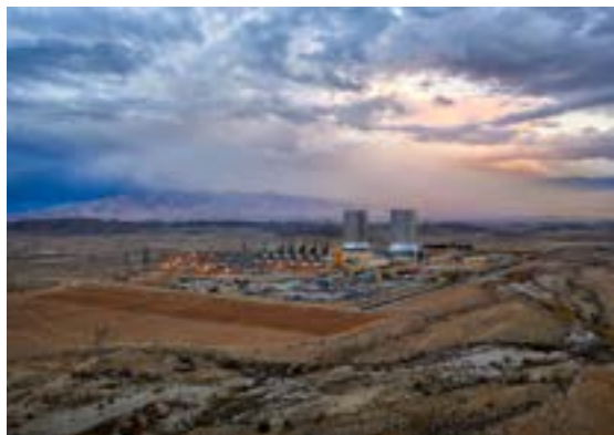
▲ המנהיג העליון לא היה "מרצה". מתקן גרעיני באיראן

על פי הדיווח, פומפאו צפוי למסור פרטים הנוגעים לטענות כי איראן העניקה מקלט בטוח למנהיגי אל קאעידה, ותמיכה לארגון הטרור, וכנראה שימסור מידע חדש על חיסולו של בכיר אל קאעידה אבו מוחמד אל-מסרי, השני בשרשרת הפיקוד בארגון, שחוסל לפני מספר חודשים בטהראן, במבצע שיוחס על פי גורמים זרים לארה"ב ולישראל. יש לציין, כי על פי דיווחים בארה"ב ראש המוסד יוסי כהן השוהה בימים אלו בווינגטון נפגש עם פומפאו.