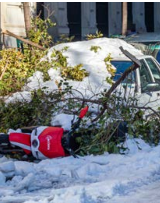
▲ קור של פעם בעשרים שנה. מדריד, השבוע