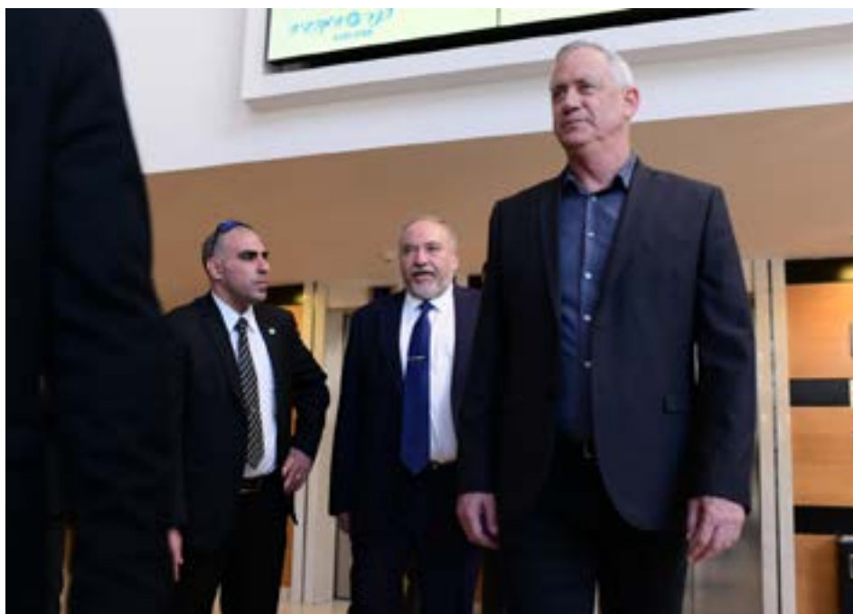
▲ "הפסיד את ההזדמנות". יו"ר כחול לבן גנץ עם יו"ר ישראל ביתנו ליברמן

המספר של יאיר, שיתקשר". האם היוזמה של גנץ נכונה מבחינה אלקטוראלית? כנראה שלא. סקר חדשות 12 שפורסם אמש, בדק את האפשרות של חיבור בין יש עתיד, כחול לבן, הישראלים, תנופה והכלכלית ובתרחיש הזה הן מקבלות 28 מנדטים, שזהו מספר המנדטים שהן מקבלות כיום בנפרד, שאר המפלגות נותרות כמעט ללא שינוי.