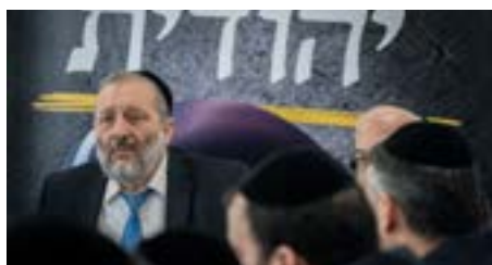
▲ קהלים חדשים. ישיבת סיעת ש"ס

חלק מרכזי בהיערכות של תנועת ש"ס לקראת המערכה הגדולה שלפנינו, נוטלים מנהלי האזורים המהווים את הזרוע הביצועית בשטח על הפעילות וההכנות ליום הבחירות. מדובר בשבועה מנהלי