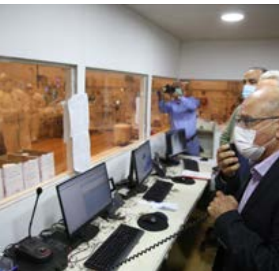
▲ שיא חדש. פרופ' חזי לוי במחלקת קורונה בבית"ח זיו

"אנחנו יכולים לנצח, וכדי לנצח נצטרך לעשות שני דברים יחד: דבר ראשון, לבוא ולהתחסן. אני חושב שכאן אין צורך להכביר במילים, הציבור בישראל נרתם לעניין וחשוב שימשיך. התחלנו לחסן היום אזרחים מעל גיל 50 וגם המורים יחוסנו בקרוב מאוד. זה חשוב כי אנחנו רוצים שהם יהיו פנויים לחנך את ילדינו בתקווה שיראו את ילדינו