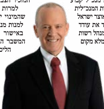
▲ תפקידים בכירים. שמיר

המזכיר הצבאי במשרד הביטחון. למרות ההודעה של כץ, לא בטוח שהמינוי יצא לפועל בשלב הזה. כדי למנות מנכ"ל למשרד האוצר יש צורך באישור הממשלה, אך כידוע בשל המשבר הפוליטי וחילוקי הדעות בין הליכוד וכחול לבן, שורת מינויים בכירים, בהם מפכ"ל המשטרה ופרקליט המדינה נתקעו בחודשים האחרונים ולא עלו להצבעה בממשלה.