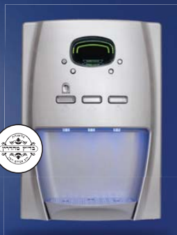
אלפא פלוס' שבת רק ב-