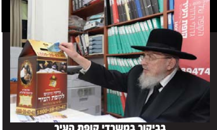
בביקור במשרדי קופת העיר