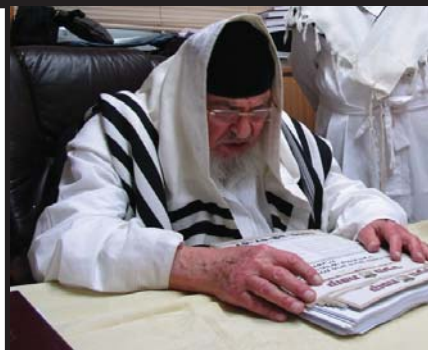
מעטיר על תורמי קופת העיר - לפני כל נדר

דמוע תדמע עיניו וכל בית ישראל יבנו את השריפה אשר שרף ה' החותמים בדמע קופת העיר