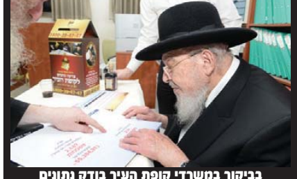
בביקור במשרדי קופת העיר בודק נתונים

על פי צוואת רבי עקיבא אייגר זיע"א ובהוראת גדולי הדור שליט"א