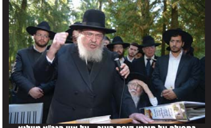
בתפילה על תורמי קופת העיר - על ציון הגר"א מוילנא