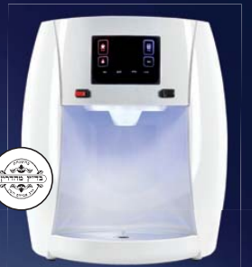
'ספיריט פלוס' שבת רק 1-