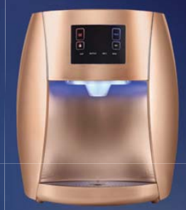
מיניבר ספיריט רק 1-