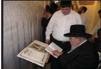
בתפילה על תורמי קופת העיר - בקבר רחל ביום ההילולא