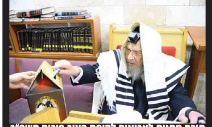
תורם מתנות לאביונים לקופת העיר פורים תשפ"ב