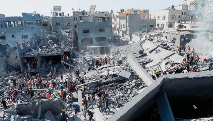
פלשתינים מחפשים נפגעים באתר תקיפות ישראליות על בתים, בחאן יונס

לדבריו, "המערכה תיכנס בקרוב לשלבים נוספים בעוצמות גדולות יותר. אנחנו נפעל לעיצוב מחדש של המרחב, והלחימה מול הטרור בעזה תימשך בשטח הרצועה ולעומקה בכל מקום ובכל זמן שנידרש לכך, בכדי להבטיח ביטחון ליישובים שיחזרו וייבנו מחדש את האזור. התמרון הוא רק שלב אחד במהלך ארוך טווח שכולל היבטים ביטחוניים, מדיניים וחברתיים שייארכו שנים".