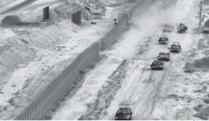
פעילות צבאית בעומק שטח רצועת עזה |