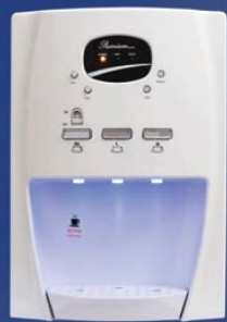
מיניבר פרימיום רק ב-