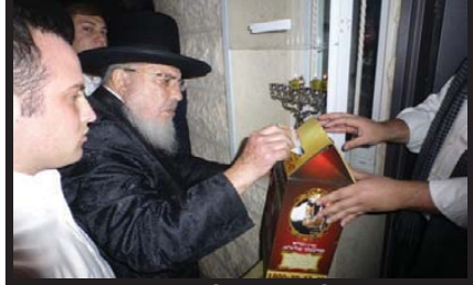
תורם לקופת העיר ליד נרות חנוכה