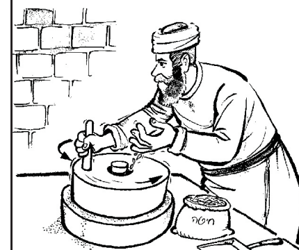
עוֹחֲנִים את החיטה