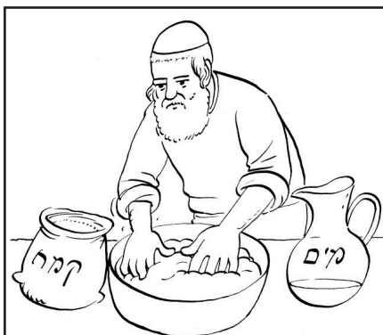
לשים את הבצק