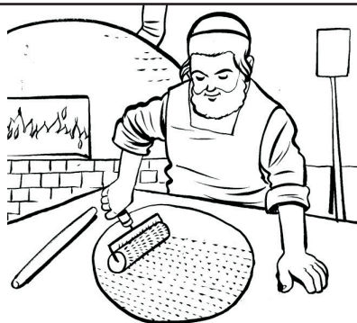
מנקבים את המצות