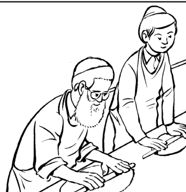
מרדדים את הבצק