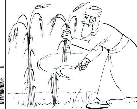
קוצרים את החיטה