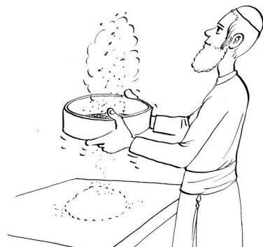
מנפים את הקמח