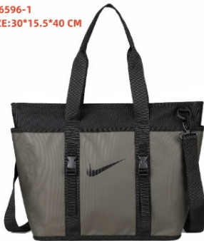
DN6596-1 SIZE:30*15.5*40 CM