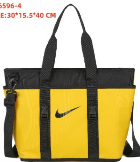
DN6596-4 SIZE:30*15.5*40 CM