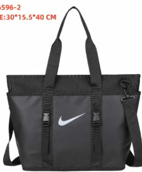
DN6596-2 SIZE:30*15.5*40 CM