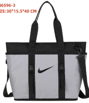
DN6596-3 SIZE:30*15.5*40 CM