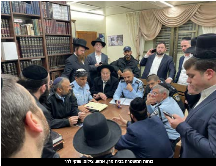
כוחות המשטרה בבית מרן, אמש.

"מי שלא צריך להגיע לגוש דן ולבני ברק - שלא יגיע" - זה המסר המרכזי שהעבירה הערב המשטרה • כתב 'שחרית' שאל איך ידאגו שאנשים לא ייתקעו בדרכים, כפי שקרה בעבר: "יתגברו אוטובוסים ויחסמו כבישים מוקדם לכלי רכב"