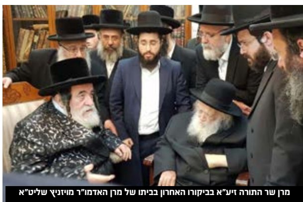
מרן שר התורה זיע"א בביקורו האחרון בביתו של מרן האדמו"ר מויזניץ שליט"א

בית המדרש לקראת האי שבתא דרגילא שבת, לפני הילולא קדישא של מרן בעל הישועות משה זיע"א, הקדיש האדמו"ר דברים לזכרו של שר התורה הגאון זצ"ל בעל זכרו הטהור והקשר העצום לבית ויזניץ עוד מבית אביו הגאון בעל הסטיפלער זצ"ל, שהיה ידוע בקשרי ידידות אל אדמו"ר החסידות. כן ידוע שהיו פוקדים את המקווה טהרה של ויזניץ מידי יום ביומו ומידי שבת בשבתו כמנהג חסידים הראשונים, האדמו"ר הרחיב בדברים לזכרו הטהור, ובסיום הורה לכל בחורי הישיבות, ולכל אברכי החסידות מכל הארץ לבוא להשתתף במסע ההלוויה לחלוק כבוד אחרון לשר התורה זיע"א.