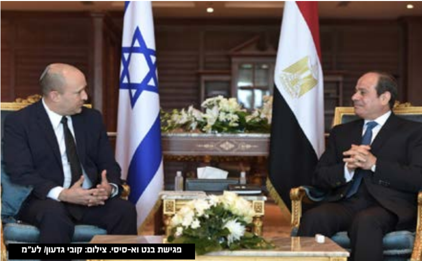
פגישה בנט וא-סיסי.

הפגישה באה לאחר ששתי המדינות הגיעו לסיכומים על קו קבוע מנתב"ג לשארם א-שייח' • בפעם הקודמת נפגש בנט עם א-סיסי בספטמבר 2021