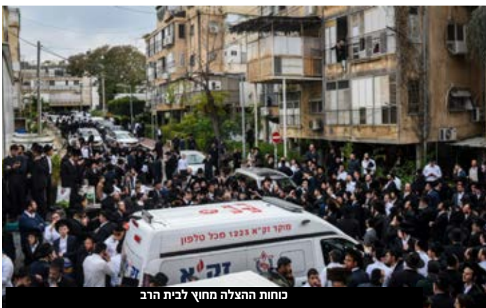
כוחות ההצלה מחוץ לבית הרב

אושי משחזר את התקופה האחרונה: "הרב היה מאוד חלש בשבוע-שבועיים האחרונים, וביממה לפני זה היה לו קוצר נשימה חזק, הוא טופל עם תרופות ועם חמצן