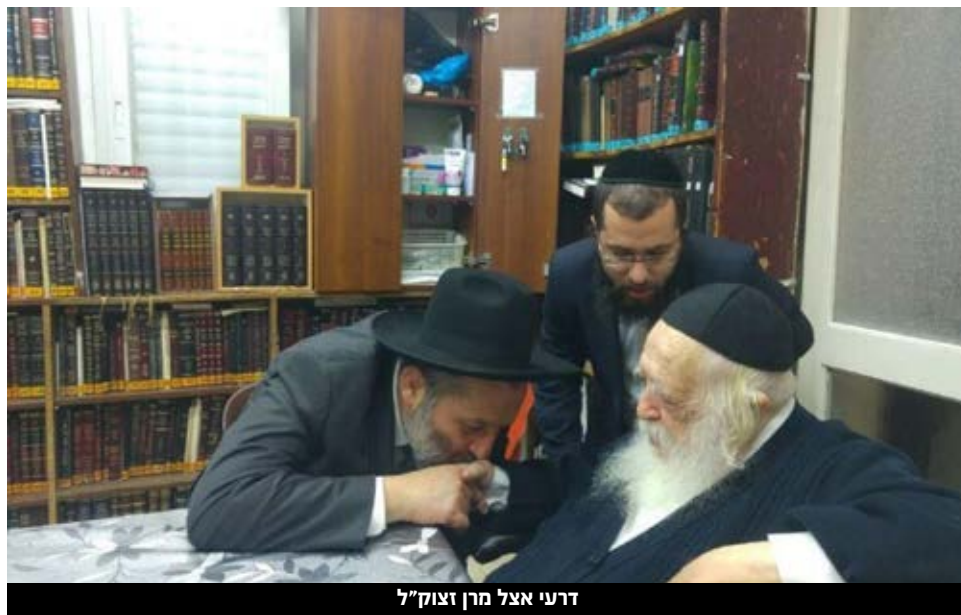
דרעי אצל מרן זצוק"ל

אדם. הוא היה מנהיג ציבור אמיתי, אשר מביתו הצנוע בבני ברק נהיג רבנות מעם ישראל - בחוכמה, ביישוב הדעת, בבקיות נדיה. אני משתתף בצער המשפחה באבלה הכבד. יהי זכרו ברוך ונשמתו צדורה בצרור החיים". ראש הממשלה לשעבר בנימין נתניהו מסר: "אני דואג עמוקות עם כל בית ישראל על פטירתו של ענק התורה ומנהיג הרבים, הרב חיים קניבסקי זצ"ל. עם ישראל איבד תלמיד חכם עצום שהיה חוליה מרכזית בשרשרת מסירת התורה מדור לדור. ביתו של הרב קניבסקי בבני ברק שימש מוקד של עלייה לרגל לבני עמנו מכל שדרות הציבור. הם שתו בצמא את מוצא פיו, ביקשו את ברכתו ואת עצותיו, ושאו תעצומות נפש מסמכותו התורנית המיוחדת במינה".