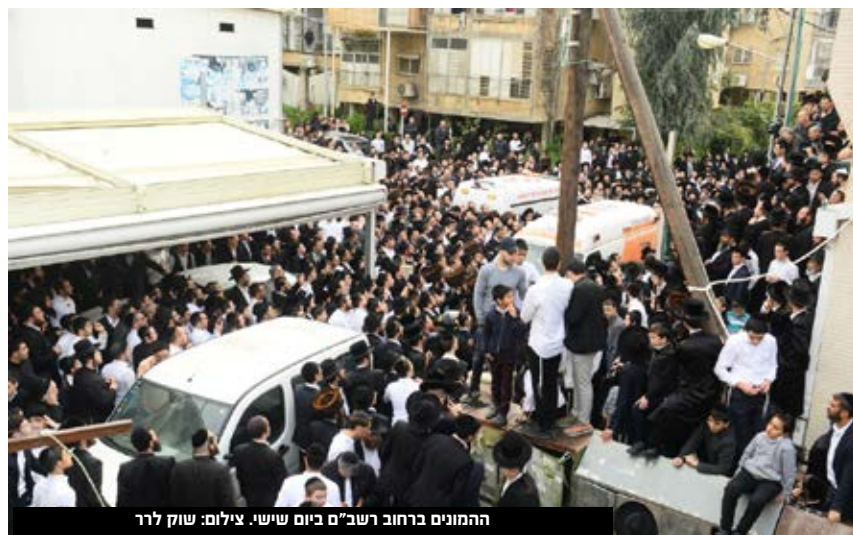
ההמונים ברחוב רשב"ם ביום ששי.

מפכ"ל המשטרה והשר לביטחון פנים הציגו בפני ראש הממשלה את ההיערכות המשטרתית לקיום הלוויית הרב בצורה בטוחה וסדורה, לרבות היערכות לאירועי חירום, בכלל היבטים - תחבורתיים, בטיחותיים, אכיפתיים ועוד.