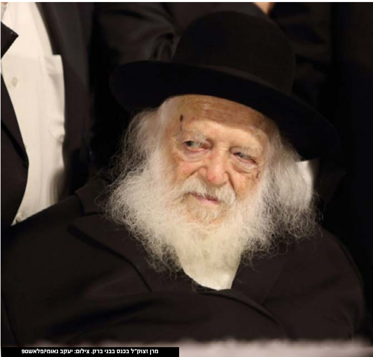
מרן זצוק"ל בכנס בבני ברק.

אלעזר צדוק טורצ'ין. חיבורו הראשון היה ספרו "שונה הלכות" על הלכה האוגד שלושה חלקים, לאחר מכן הוציא מרן שר התורה את ספריו: שערי אמונה על סדר זרעים, דרך אמונה חמישה כרכים ואת ספרו דרך חכמה. במרוצת השנים חיבר מרן שר התורה זיע"א עשרות ספרים ובהם: שקל הקודש, אורחות ישר, שית השדה, וכן קונטרסים שונים על כשרות בחגבים, דברים המועילים לזיכרון, מסכת סופרים, מסכת גרים, מסכת כותים, קנים הגוף, קנין פירות ומסכת