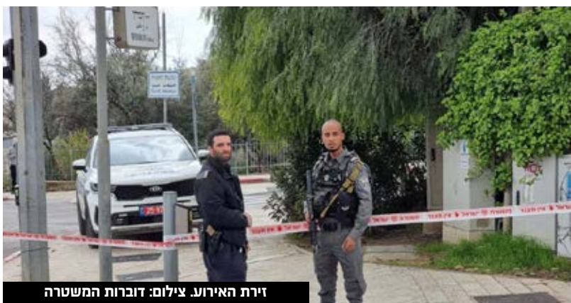
זירת האירוע.

אתמול בבוקר בסביבות השעה 9:35, הגיע מחבל (28) תושב שכונת אבו-תור שבמזרח העיר ירושלים, לרחוב דוד רמז ולאחר שהתקרב לעבר אזור שעסק בפעילות ספורטיבית וחלף במקום, שלף סכין ודקר אותו תוך כדי שהשניים מתעמתים ואזרחים נוספים מסייעים לנדק. שוטרי מחוז ירושלים שהוזעקו למקום, הגיעו במהירות לזירת הפגיעה שם הבחינו במחבל שבשלב מסוים החל מתקדם לעברם, על אף קריאות של השוטרים לעברו ולחדול ולאחר שקריאתם לא נענתה, אחד השוטרים ביצע ירי בודד לפלג גופו התחתון של המחבל והוא נוטרל. כתוצאה מפגיעה הדקירה, פונה האזור שנדקר באורח קל לקבלת טיפול רפואי בבית החולים שערי צדק בירושלים כמו כן, המחבל פונה אף הוא לקבלת טיפול רפואי בבית החולים.