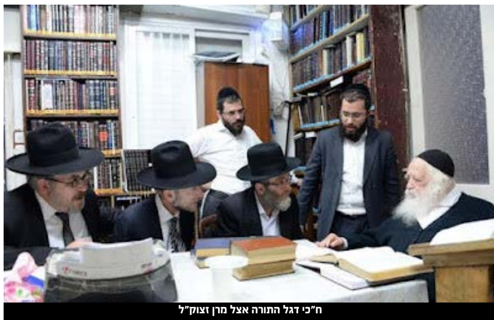
ח"כ דגל התורה אצל מרן זצוק"ל