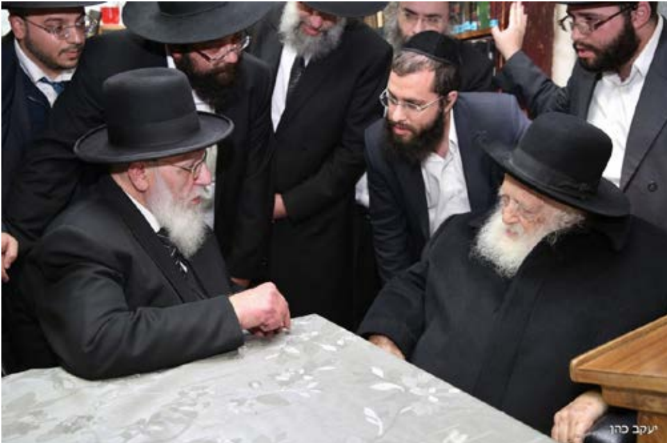
מרן נשיא המועצת שליט"א עם מרן שר התורה זצוק"ל.

דגל התורה: "מבכים מרה את לכתו של ספר התורה החי שעלה בסערה השמימה" • תנועת ש"ס: "גאון הגאונים משיירי כנסת הגדולה, שר התורה ועמוד ההוראה אשר כל רז לא אניס ליה, ממעתיקי השמועה אשר לא פסיק פומיה מגירסה"