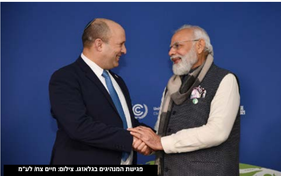
מגישת המנהיגים בגלאזגו.

ראש הממשלה יפגש במהלך ביקורו עם ראש ממשלת הודו ועם גורמי ממשל בכירים נוספים, וכן יבקר את הקהילה היהודית במדינה.