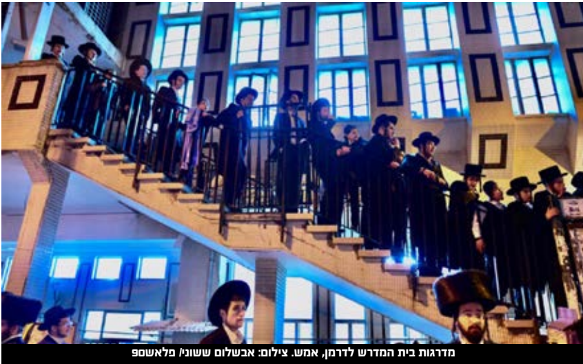
מדרגות בית המדרש לדרמן, אמש.

בתוך כך, עיריית בני ברק נערכת לפריסת מסכי ענק ומערכות הגברה באזורים נרחבים בעיר, על מנת למנוע דוחק באזור ההלוויה.