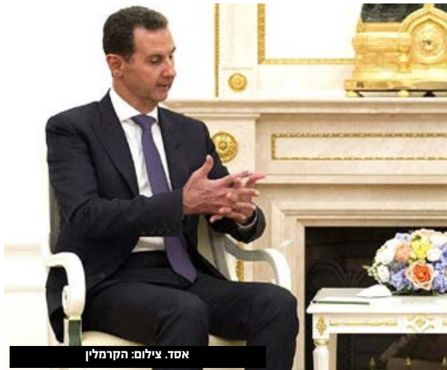
אסד.

מדינות המפרץ ניתקו עצמן מסוריה בזוג נשיאותו של טראמפ אולם מאז חזר בידן לחתימה על הסכם גרעין מרוכך, מחשש ליציירת ציר איראני - סורי, החלו סעודיה והאמירויות בהתקרבות המחודשת.