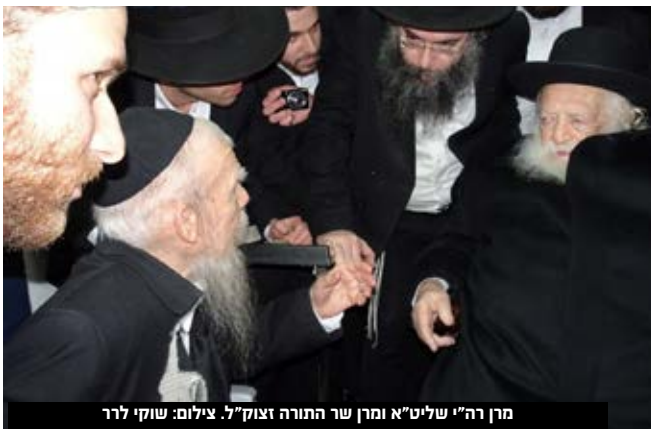
מרן רה"י שליט"א ומרן שר התורה זצוק"ל.

בתוך כך, ביום שישי האחרון סיפרו בני הבית של מרן ראש הישיבה כי הם נכנסו להודיע לרבינו שליט"א, "ונתעטף רבינו בשתיקה משך דקות ארוכות ונאנח עמוקות: אוי! אוי והוסיף ואמר: הרי הרבה זכויות היו לו, הרבה זכויות והתמדה, איזה