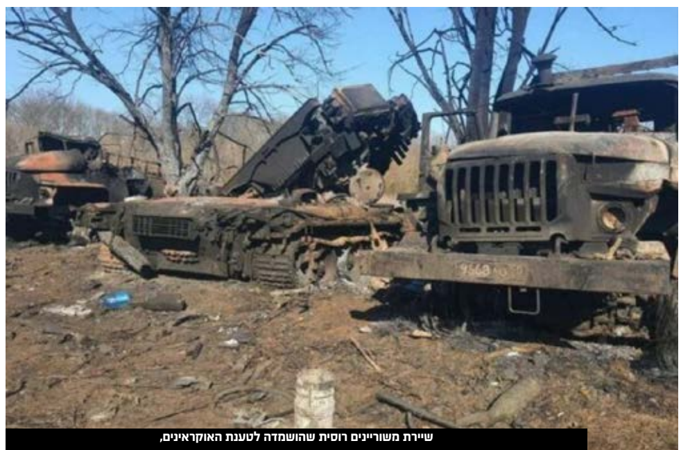
שיירת משוריינים רוסית שהושמדה לטענת האוקראינים.