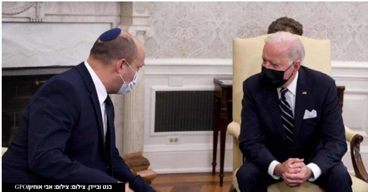
בנט וביידן.

"משמרות המהפכה עומדים מאחורי ההתקפות על אזרחים וחייילים אמריקנים בכל רחבי המזרח התיכון, כולל בשנה האחרונה. הם אלה שעמדו מאחורי התכנונים להתנקש בחייהם של פקידי ממשל אמריקנים בכירים. משמרות המהפכה נטלו חלק ברצח מאות אלפי אזרחים סורים, הם הרסו את לבנון, הם עוסקים בדיכוי רצחני של אזרחים איראנים. הם הורגים יהודים מפני שהם יהודים, נוצרים מפני שהם נוצרים, ומוסלמים מפני שאינם נכנעים להם", הוסיפו. בנט ולפיד המשיכו וכתבו כי האיראנים "הם חלק מרכזי ובלתי נפרד במכונת הדיכוי הרצחנית באיראן. ידיהם מוכתמות בדמם של אלפי איראנים