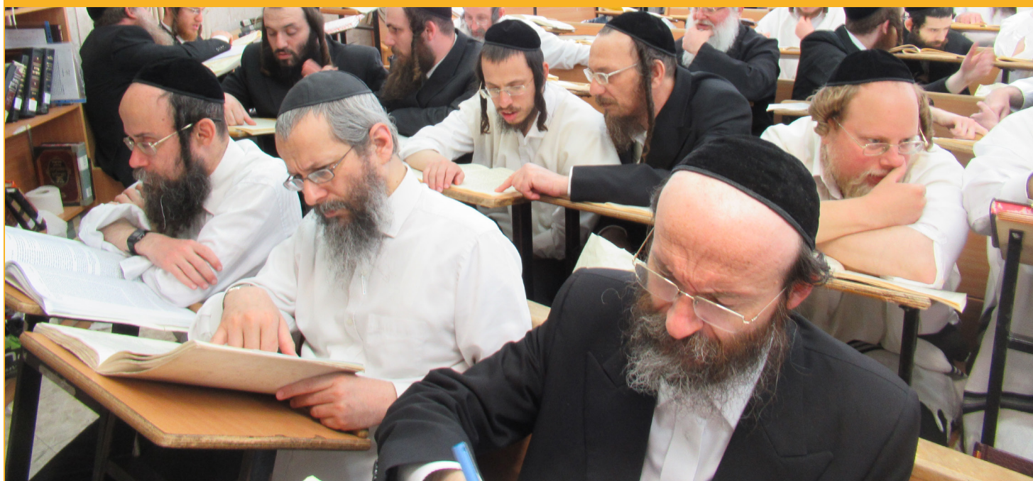
בשבת תחכמוני אין ישיבת מיר

מוחמד הגיע. בפעם השלישית הוא צם ביוהכ"פ, הוא גם התפלל שם, אך כשחזר המתינה לו הפתעה מפחידה.