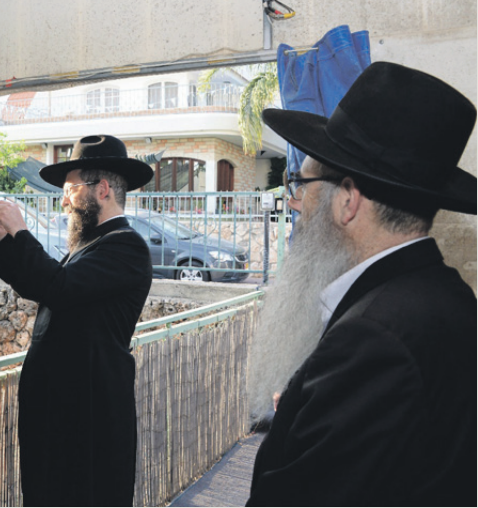
קביעת מזוזה לחיידר החדש

טיפ לקונים: הקפידו לרכוש דירות רק דרך מתווכים המתגוררים במקום ומכירים את הניואנסים. מתווכים חיצוניים עלולים להפיל קונים תמימים בפח ולסנוור אותם בהבטחות סרק על אזורים שלטאורה סמוכים לקהילה ולמודסותיה (הם לוקחים אותם בנסיעה מהירה ברכב ומשכנעים ש"תראו זה ממש כמה דקות מהבית כנסת" בלי שישיומו לב כמה זה רחוק ומנותק באמת... - ר. גיל) שהם בגדר מתחרדים ובפועל משתייכים לאוכלוסיות סוציאקונומיות נמוכות שאינן הולמות מגורי אדם חרדי. לדוגמה: אחד הרחובות בעיר הוא בתחילתו חרדי ובסופו אזור שיכוני שאינו מומלץ למגורים ויש מתווכים המשווקים אותו כרחוב מאד כדאי. בנוסף יש דירות הנמכרות מטעם חברות משכנות ללא טאבו וצריך לקחת בחשבון שבנקים רבים לא יאשרו עליהם משכנתאות. חשוב לבצע עבודת שטח לפני כל קנייה כי גם באזורים החרדיים יש בניינים מומלצים יותר או פחות.