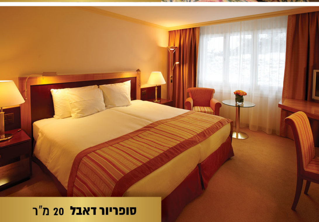
סופריוור דאבל 20 מ"ר