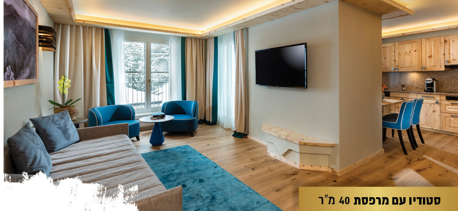
סטודיו עם מרפסת 40 מ"ר