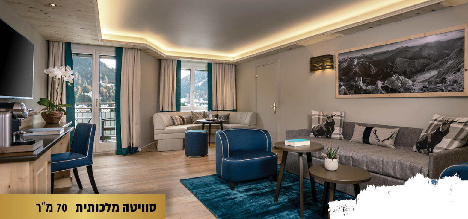
סוויטה מלכותית 70 מ"ר