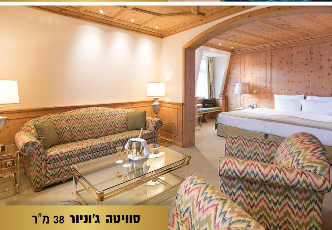
סוויטה ג'וניור 38 מ"ר