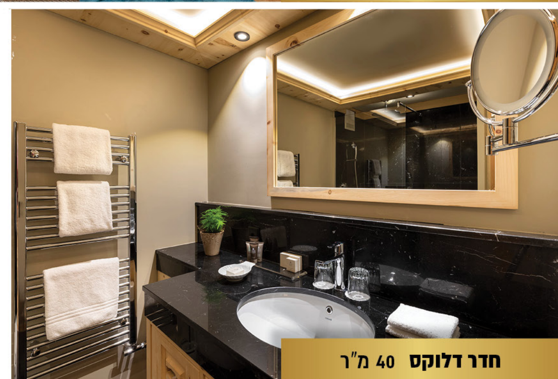
חדר דלוקס 40 מ"ר

תוכלו לבחור בין חדרים זוגיים, חדרי ליגה ודלוקס, סוויטות משפחתיות וסוויטות יוקרה, מרפסת נוף מושקעת, סוויטה הכוללת סלון נפרד ועוד אופציות להתאמה מושלמת.