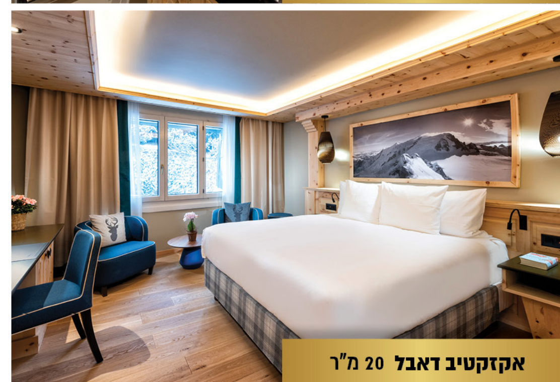
אקזקטיב דאבל 20 מ"ר