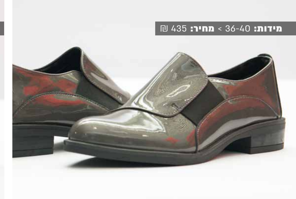
מידות: 36-40 < מחיר: 435 ₪