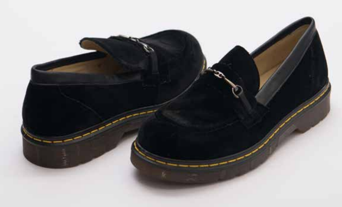
מידות: 36-40 < מחיר: ₪ 420