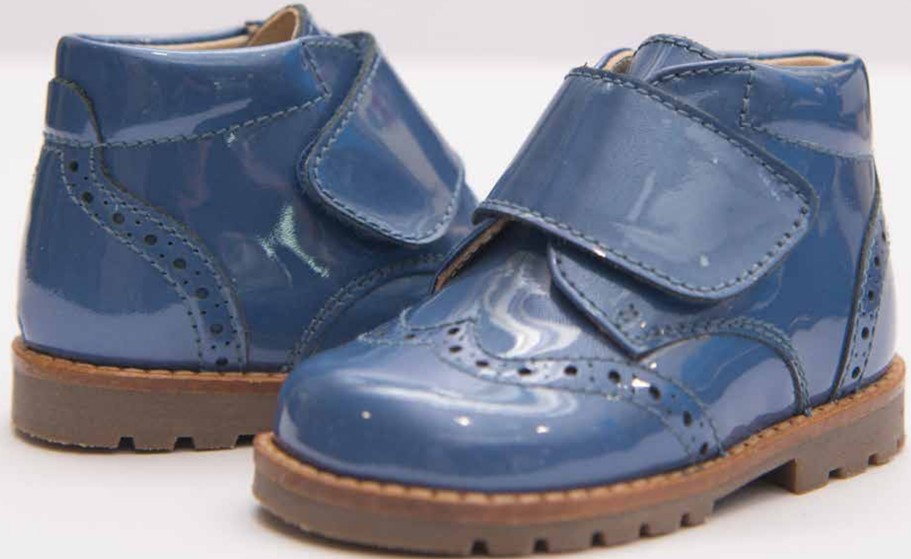
מידות: 19-26 < מחיר: ₪ 335