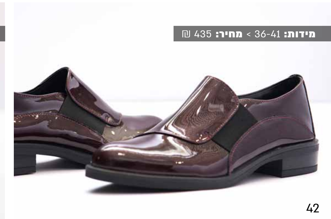
מידות: 36-41 < מחיר: 435 ₪