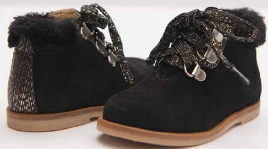
מידות: 19-22 < מחיר: ₪ 335