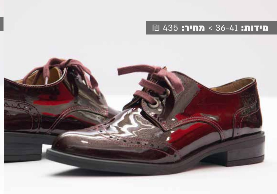
מידות: 36-41 < מחיר: 435 ₪