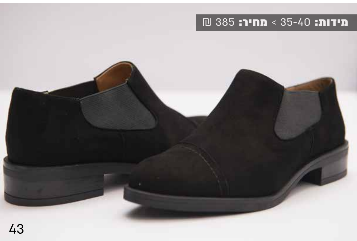
מידות: 35-40 < מחיר: 385 ₪