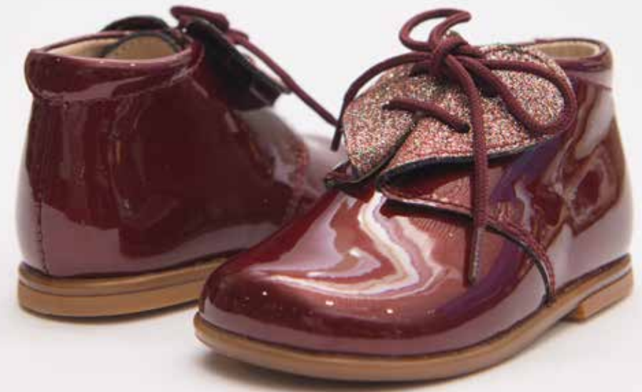
מידות: 19-26 < מחיר: ₪ 355