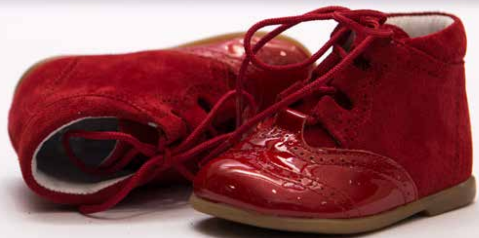
מידות: 19-25 < מחיר: ₪ 295