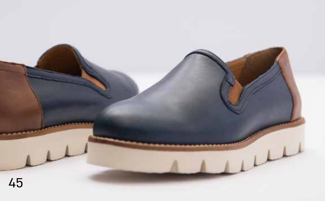
מידות: 36-41 < מחיר: ₪ 435