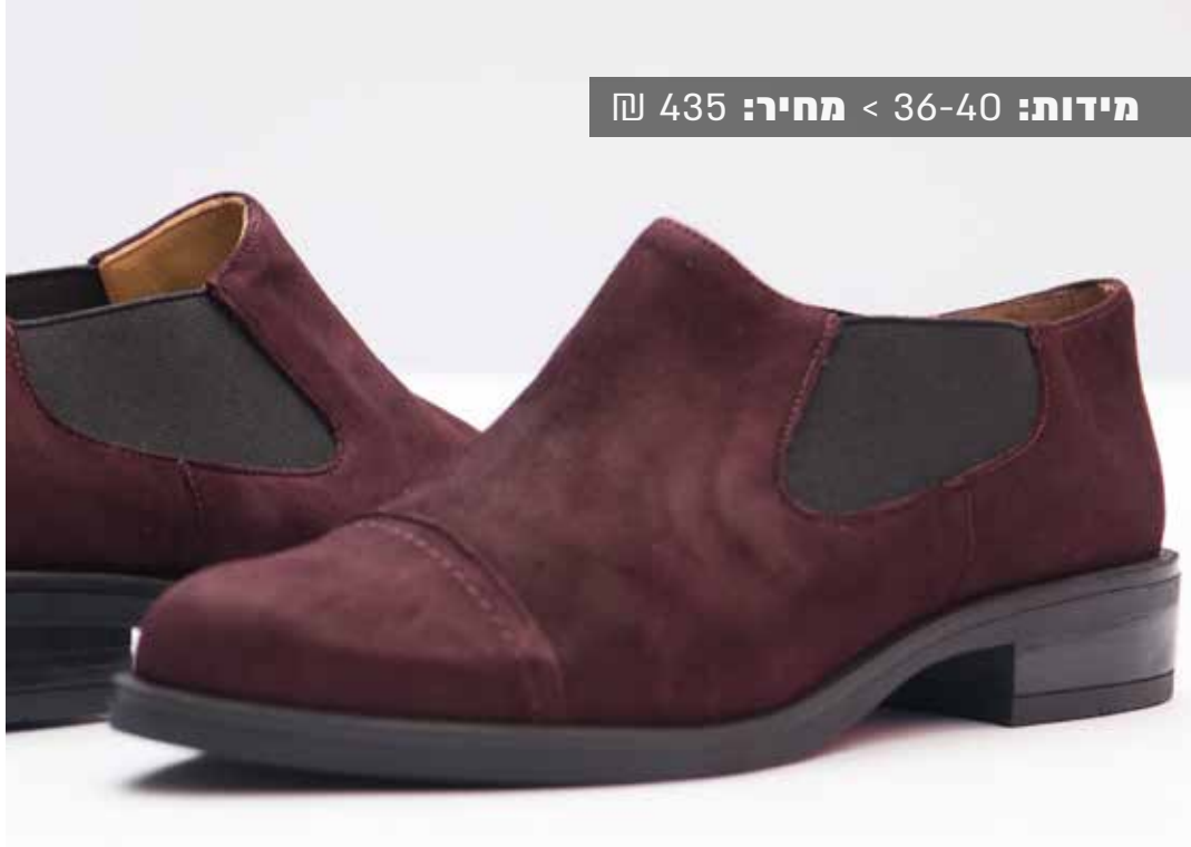
מידות: 36-40 < מחיר: 435 ₪