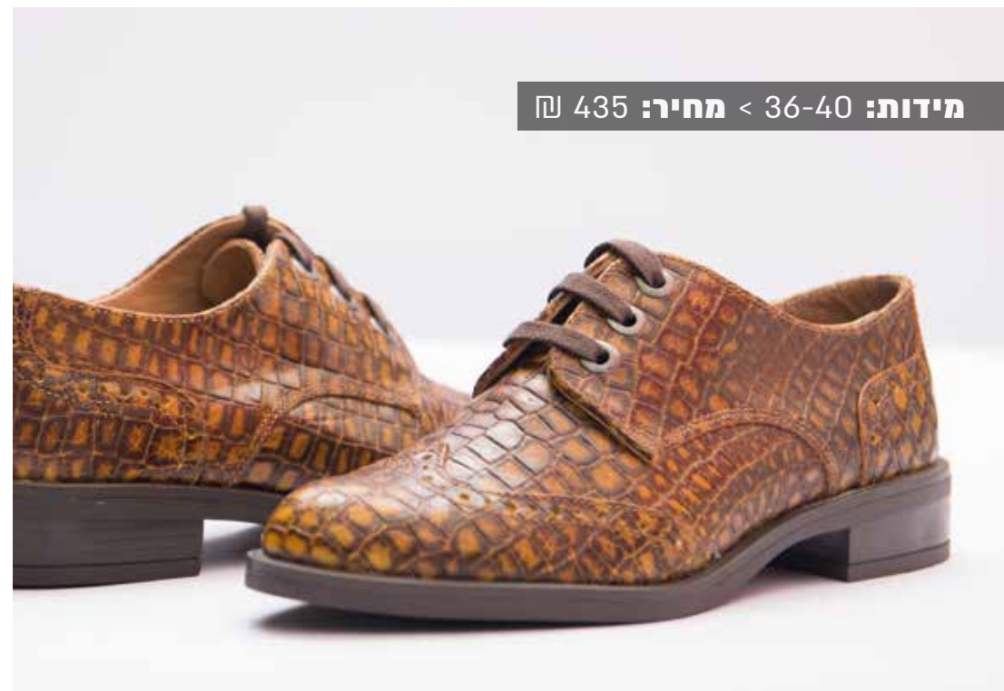
מידות: 36-40 < מחיר: 435 ₪