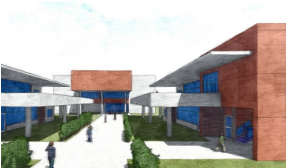
אחד ממסודות החינוך המתוכננים