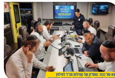
שואה של נכד. חוקר של פליטות תבי' חוליצן פליטים אוקרינים.

ברגע שהתחתונים מפסיקים לירות צריך להפסיק עם ההתלהף של קליטת פליטים, אבל כרגע יש סכנת חיים, אנשים מגיעים ככל מיני מקומות שיש בהם קרבות. ברגע