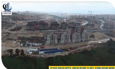
המשו שכונה אחת. רמה ה' מתורם הרחוק. צילום קבוצת הזוכים