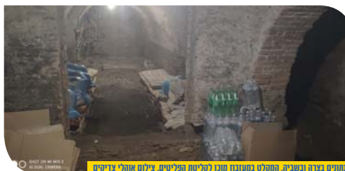
התנאים בצרה ובאנר. הפקולט במעברו מן לקליטת הפליטים.

עבור האוקרינים זה יכול להיות פתרון מצוי. גם שכונה מכורה הארץ, וגם יחסית מדובר בשכונה די נפרדת בתוך רמה ה', כך שהשכונה החרדית רמב"ש ה-1 לא תפריע להם, והם יוכלו לחיות בשלום עם המיקום שלהם.