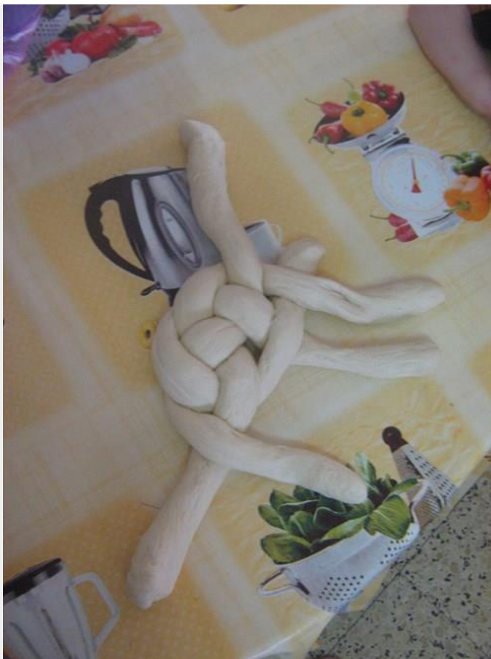
5. חוזרים על הפעולה מהכיון ההפוך. לוקחים את הנחש השני משמאל, למטה (שהיה האמצעי התחתון) ומעבירים אותו לכיוון ימין, מתחת לנחש הסמוך לו (לפני כן היה הימני העליון)