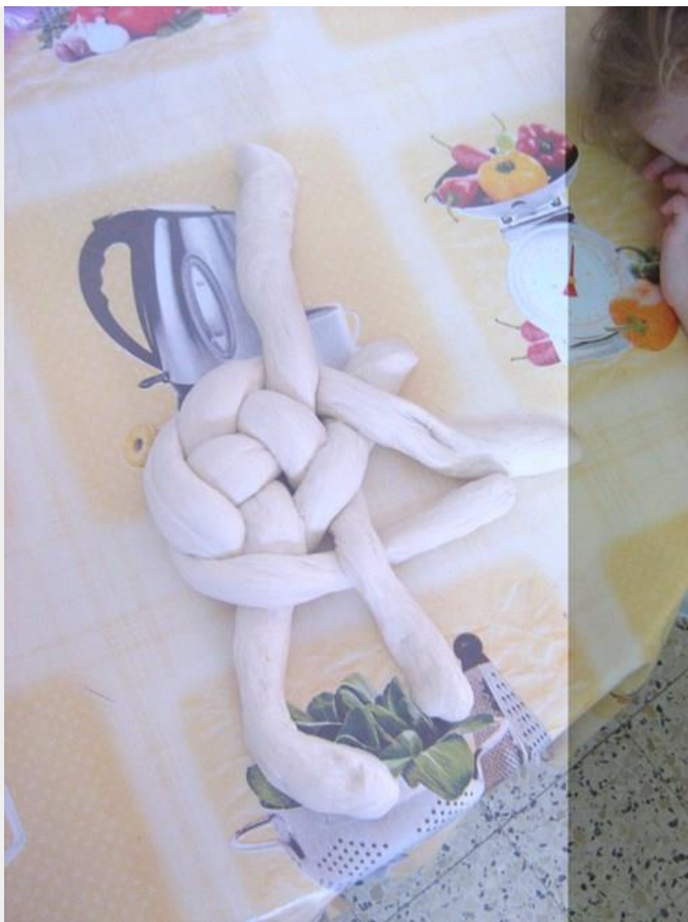
ממשיכים עם אותו נחש, מעבירים אותו מעל הנחש הסמוך לו, לכיוון ימין. 6.