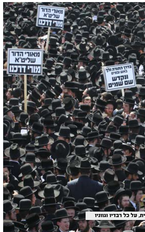
יית, על כל רבדיו וגונוני

מעשה ביהודי מומר שפגש ביהודי מומר אחר ושח לו על מה שמעיק עליו: לפעמים מתעוררים בו נקיפות מצפון נוראיות על מה שהוא חולל והוא לא יודע איך להתמודד עימם. אמר לו המומר השני: גם אני סבלתי מזה אבל מצאתי דרך איך להסתדר עם זה. בכל פעם שגבר עלי