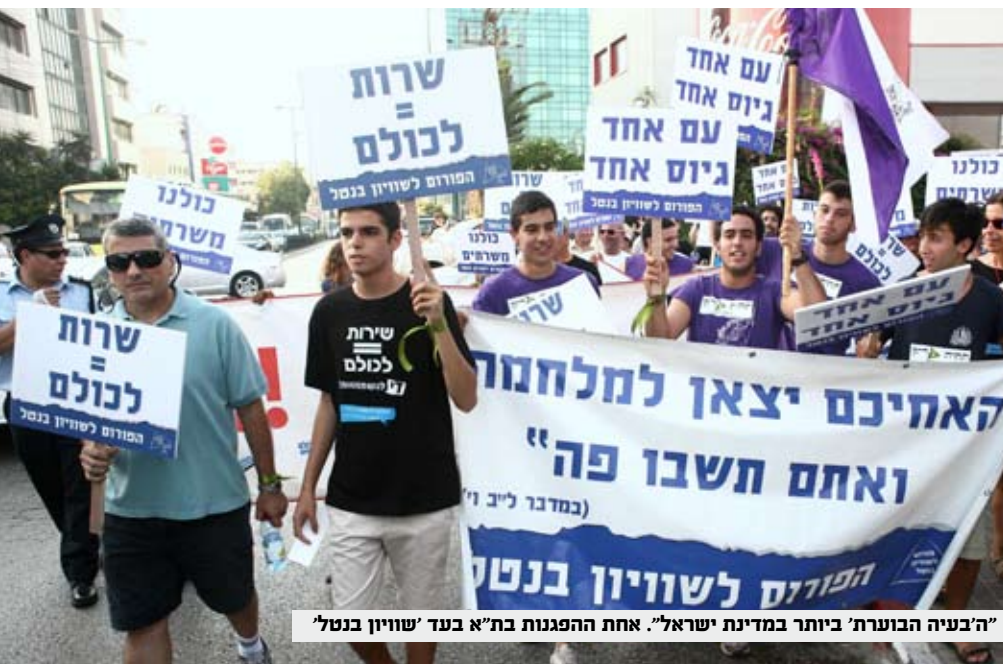
"ה'בעיה הובערת' ביותר במדינת ישראל". אחת ההפגנות בת"א בעד 'שוויון בנטל'

אז נכון שלונדון הוא עיתונאי בוטה, אבל הוא לפחות כנה, ולא מתבייש להגיד את המניע האמיתי למחול השדים שמתחולל סביבנו. הפחד שלהם הוא מפני הריבוי הטבעי של החרדים, שלטון הדמוקרטיה שהם יצרו עתיד לפעול נגדם כבומרנג. הם משקשקים פחד מוות מהרגע בו החרדים יהיו רוב במדינה, ושוב לא יוכלו לנהוג