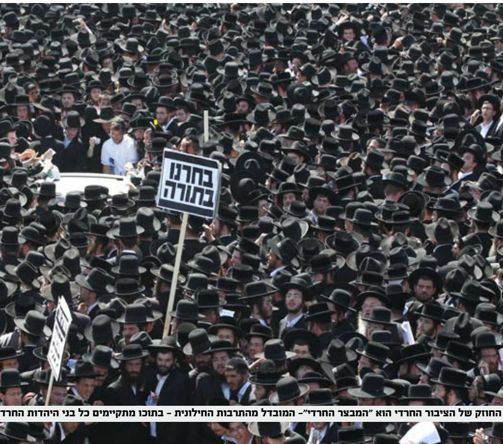
החוזק של הציבור החרדי הוא "המבצר החרדי" – המובדל מהתרבות החילונית – בתוכו מתקיימים כל בני היהדות החרדית

בעצם הדיבורים על התגייסות לשירות לאומי או אזרחי כבר יש שינוי מהותי של עצם המושג "יהודי חרדי"!