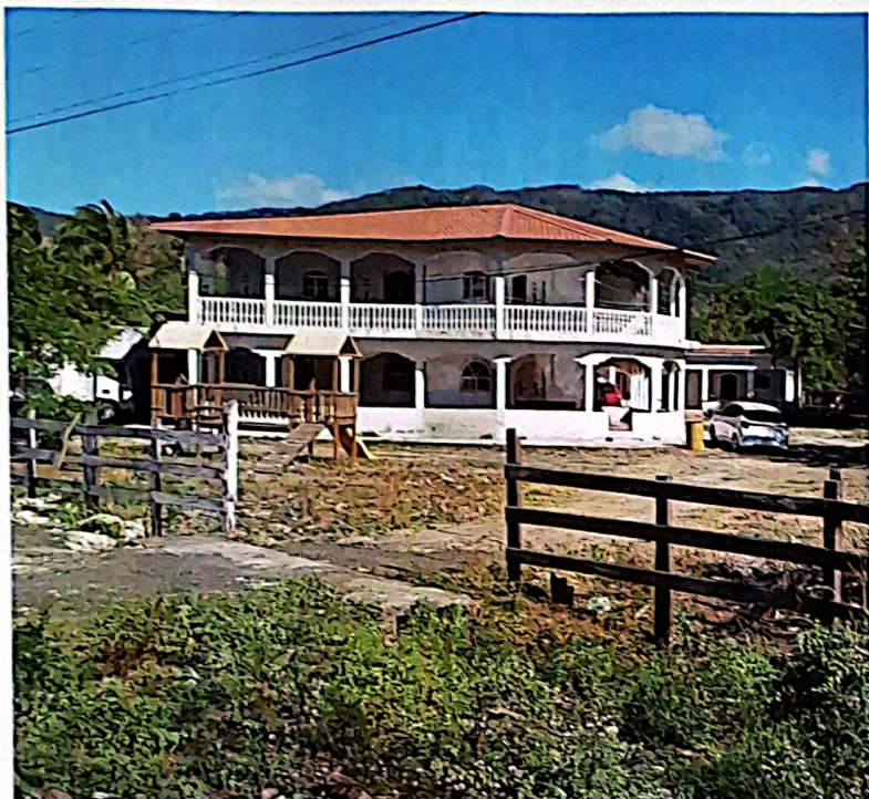
מכלט מעבר לרחוב. תמונה פטרמיית של מתחם 'כנישתא חדא'

היו לא מעט חומרות ואיסורים חוזרים, בעיקר איסור גורף על אכילת עוף וציצים, אבל נחונן לא בהיקף המרושע של השנים האחרונות, כשנחמון נסל את ההנהגה