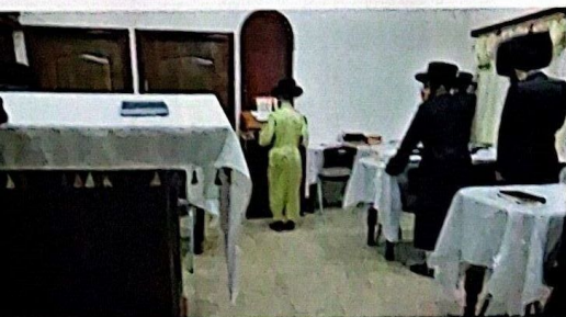
בית כנסת לכל דבר. מעריב של מוצאי שבת בימינו שנת חדא