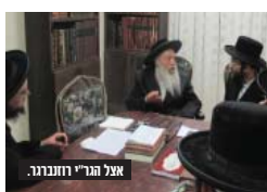
אצל הגר"י ורונברג.