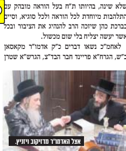
אצל האדמו"ר מדו"קוב וויניץ.

כמו"ץ כיבוד הופענות הרבנים הגאונים, הגרש"א פריינד שליט"א, חבר הבית"ץ העדה החרדית, הגרש"א שפירא שליט"א - רב דקלה חסידים בני ברק וראב"ד קהל מחזיקי הדת, הגרש"א שטרן שליט"א - רב מערב בני ברק וגאב"ד שערי הוראה, הגר"ש פולק שליט"א - רב מושב בית חלקיה.