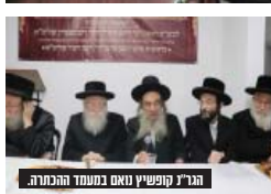
הגר"י קופשיץ נאם במסגרת ההכרזה.