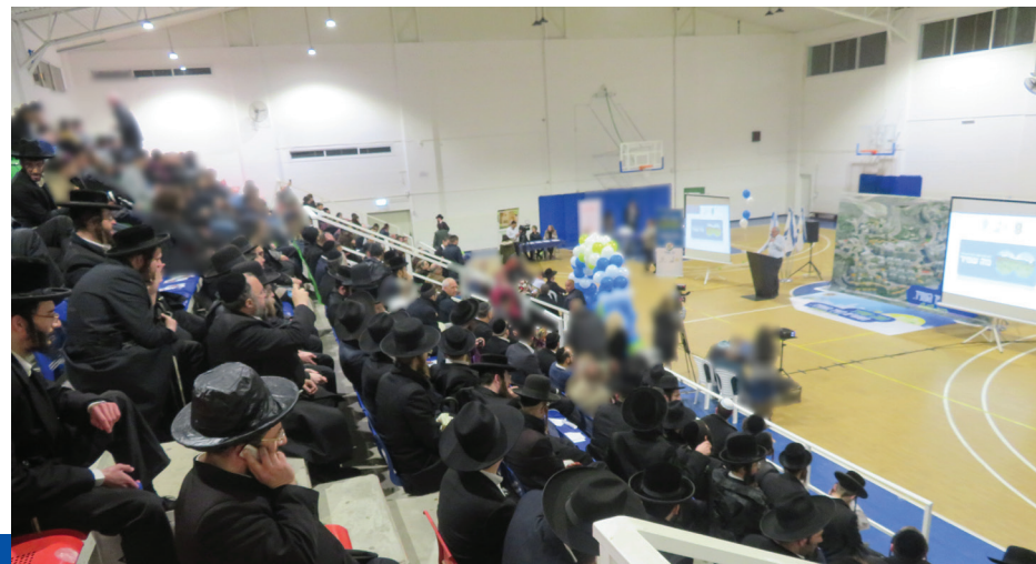
ברצון התושבים. כנס הסברה של העירייה

"תנו את דעתכם לבקשתנו והתאימו בבקשה את מקום מגורכם לתכנון שבוצע בשכונה על ידי נציגי העיר – רמה ד' מגזר חרדי, נוה שמיר מגזר כללי. איש לא יוכל להלין כלפינו אם לא ימצא בשכונה העתידית מאפיינים אחרים מהמאפיינים הנדרשים לו"