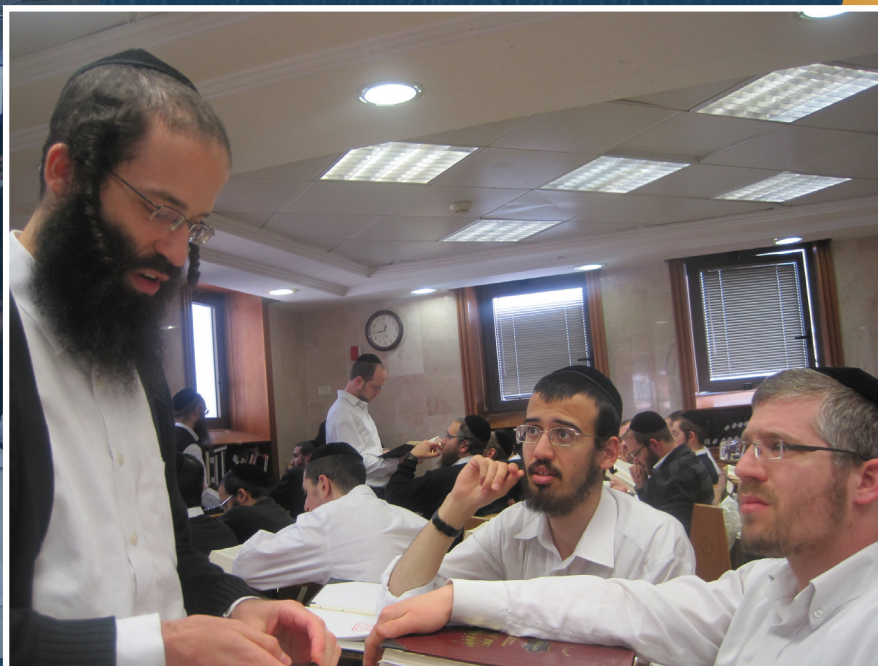
ליבון נושאים הלכתיים בנושאים העומדים על הפרק