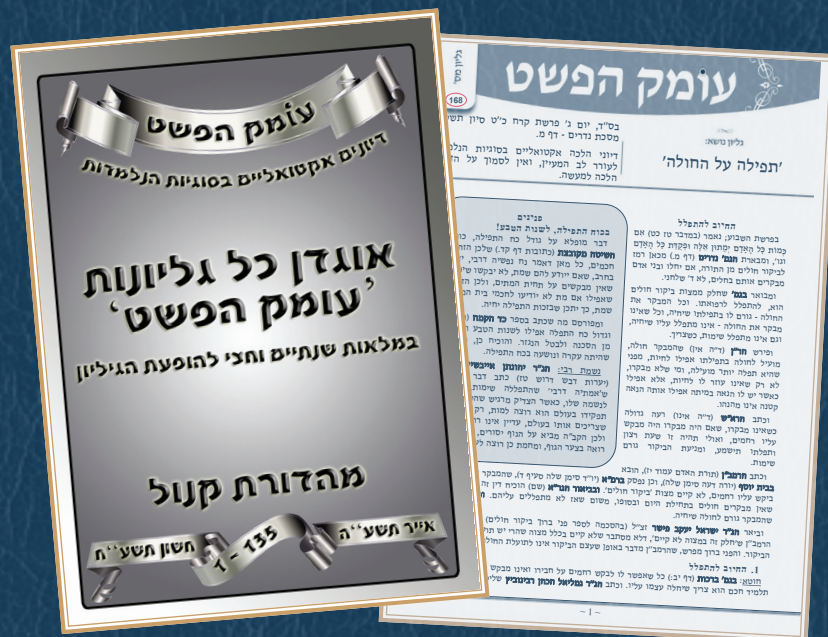
גליונות "עומק הפשט" המופצים מדי שבוע ברחבי ארץ ישראל וחברת "אוגדן" לכל הגליונות שיצאו עד כה

מאמרי הלכה אלו, מתפרסמים במגוון מקומות מלבד הגליון החשוב, וביניהם בחוברת החשובה "אוסף גליונות" היוצא לאור מדי שבוע, ובו מפרי תורתם של גדולי ישראל שליט"א. כמו כן מתפרסמים מאמרי המכון בספרים, ב"אוצר החכמה" ובמאגרים תורניים שונים.