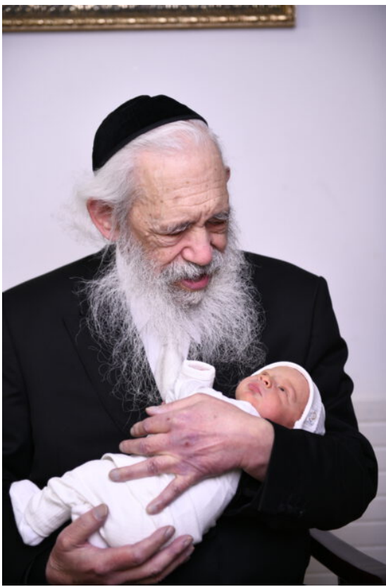
להפוך לאבא בגיל 88 זה אפשרי, אם יש אמונה וביטחון. ראש הישיבה והרן המלד, השבוע

הרגעים הבאים בשיחה היו נוראי הוד. התחושה הייתה שאנחנו עדים כאן למילים נשגבות, שלא קשורות בכלל לדור ולתקופה. אפילו תלמידיו המקורבים של הרב נתקפו אדם והלם לשמע הדברים. ההרגשה הכללית הייתה שאנחנו יושבים בארבע אמותיו של יהודי אשר השגותיו בקודש רחוקות ת"ק פרסה מההשגות החומריות שלנו. ראש הישיבה חוכך בדעתו האם לומר את הדברים הבאים ולבסוף מחליט לחיוב: