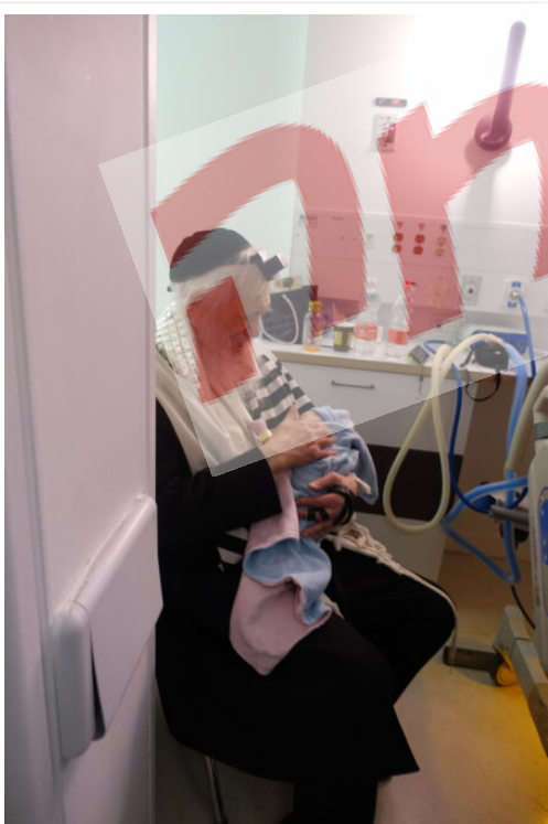
'בכל נפשך ובכל מאודך'. ראש הישיבה קורא קריאת שמע עם התינוק במחלקת הוילדות

עכשיו, כאשר הנס קרה כבר, ולמרות הגיל המבוגר נולד לי בן – העבודה של הציבור היא הרבה יותר קלה. כי כמו שאני זכיתי – כל אחד יכול לזכות. כי אם המטרה היא כבוד שמיים, הכל אפשרי, ואין שאלות". זמננו תם. דקותיו של ראש הישיבה מדודות, ויש גם את השמחה המתקרבת שאליה צריך להיערך. אבל למרות הכל הוא מעניק לנו ולקוראי 'משפחה' את ברכתו: